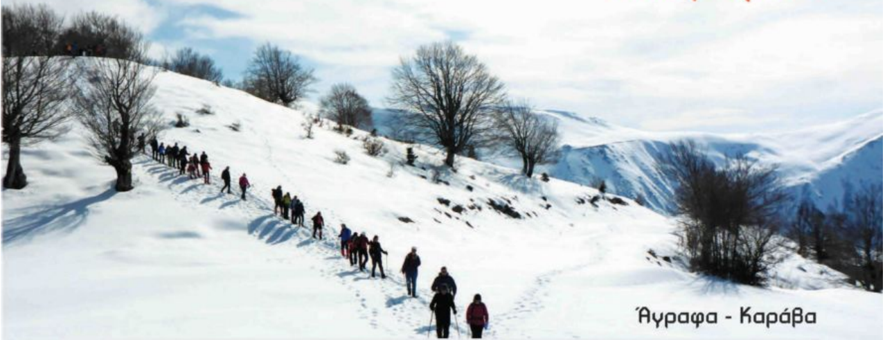
Άγραφα - Καράβα